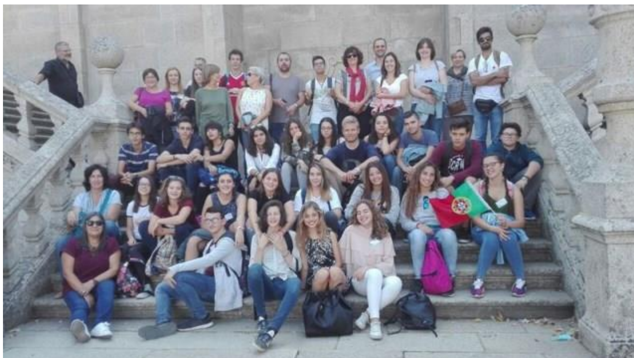
Progetto Erasmus Plus